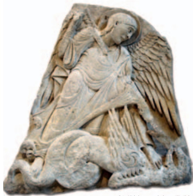
Saint Michel terrassant le dragon, XII e siècle